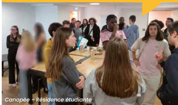
Canopée - Résidence étudiante

Pour faciliter l'installation des habitants et favoriser les échanges entre voisins, Touraine Logement multiplie les initiatives conviviales.