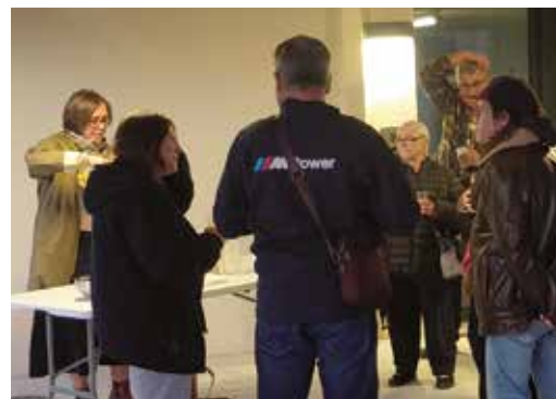
Sorigny - Résidence Pierre de Ronsard

Autre initiative, à La Riche : le Café des habitants , un temps convivial et informel pensé pour renforcer la proximité entre voisins et ouvrir le dialogue sur la vie dans les résidences.