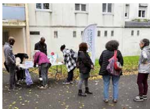
La Riche - Résidence 8 mai

L'objectif ? Favoriser les échanges et mieux comprendre les besoins exprimés par les résidents.